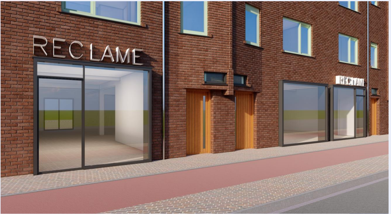
Artist impressie na verbouwing, aan deze foto kunnen geen rechten worden ontleend