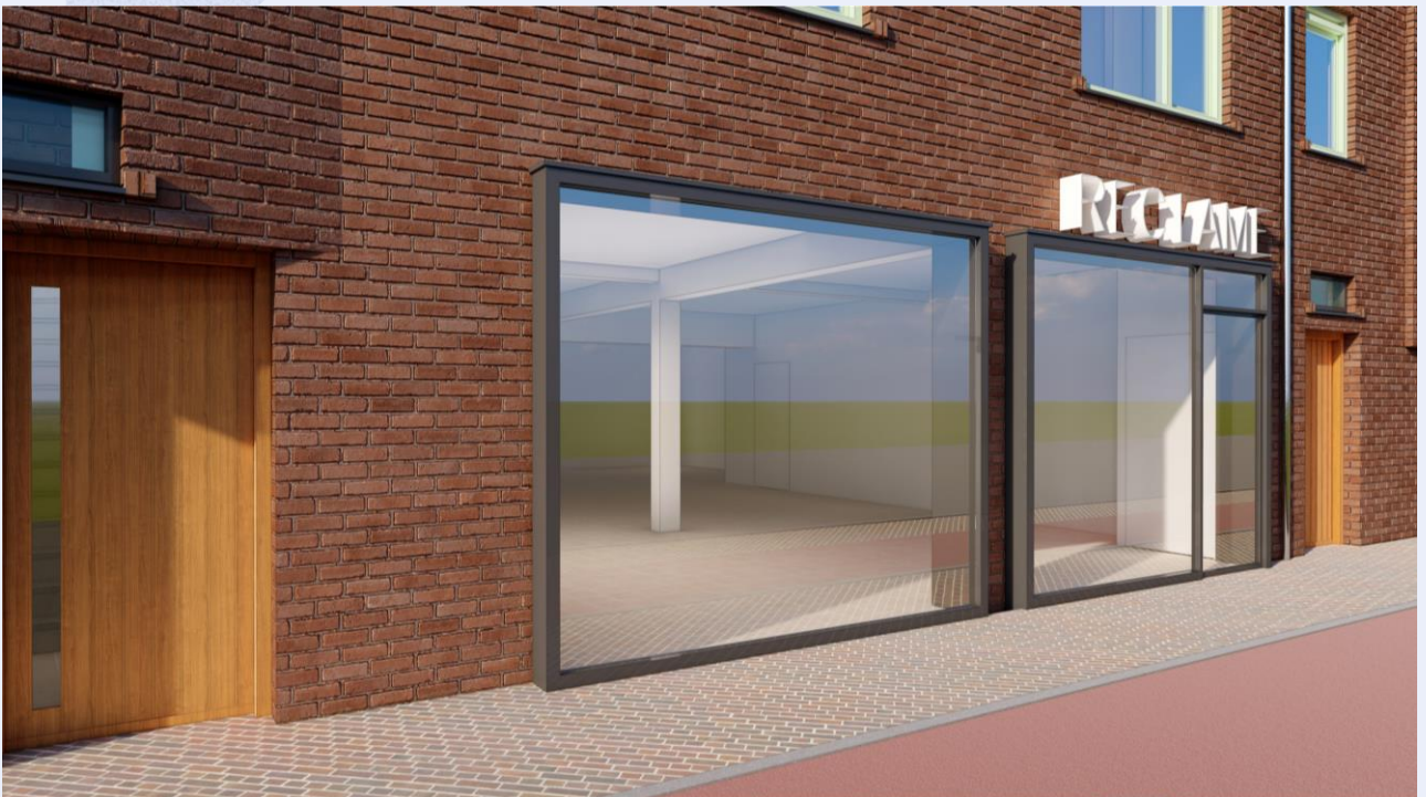
Artist impressie na verbouwing, aan deze foto kunnen geen rechten worden ontleend