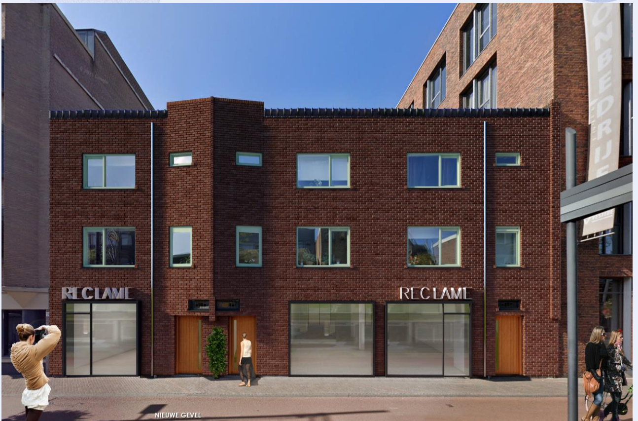
Artist impressie na verbouwing, aan deze foto kunnen geen rechten worden ontleend